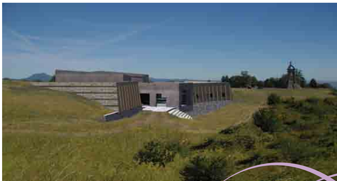
Simulation du futur équipement. Vue depuis le sud du plateau de Gergovie

* CAUE : Conseil d'Architecture, d'Urbanisme et de l'Environnement ; ABF : Architecte des Bâtiments de France ; SRA : Service Régional de l'Archéologie ; DREAL : Direction Régionale de l'Environnement, de l'Aménagement et du Logement.