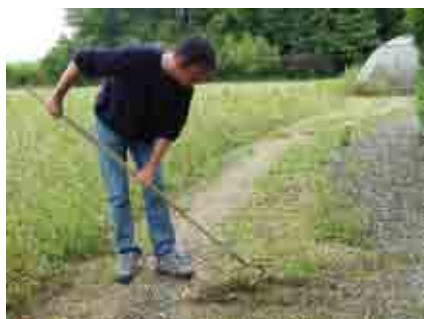
Désherbage manuel

Les pesticides, ou produits phytosanitaires, regroupent les herbicides, insecticides, etc. Ils présentent des risques pour la santé à la fois pour l'utilisateur, pour nos enfants et nos animaux domestiques. Ils posent également des problèmes environnementaux : l'équivalent d'un bouchon de stylo de désherbant suffit à polluer 20 km d'une rivière d'1 mètre de large et de 50 cm de profondeur.